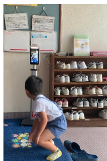
【キッズ AI サーモカメラ 2 台】

カメラの前に立つだけで、①園児の本人確認、②マスクチェック、③検温、④登降園の時間記録を一瞬で登録し、発熱アラーム等登園時の一連のコロナ禍での園児受入に必要な対応を非接触で完了し、園の業務ソフトに記録データを自動で保存できるようになりました。